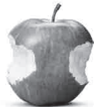
Für den Zweikampf