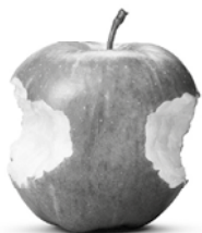
Für den Zweikampf