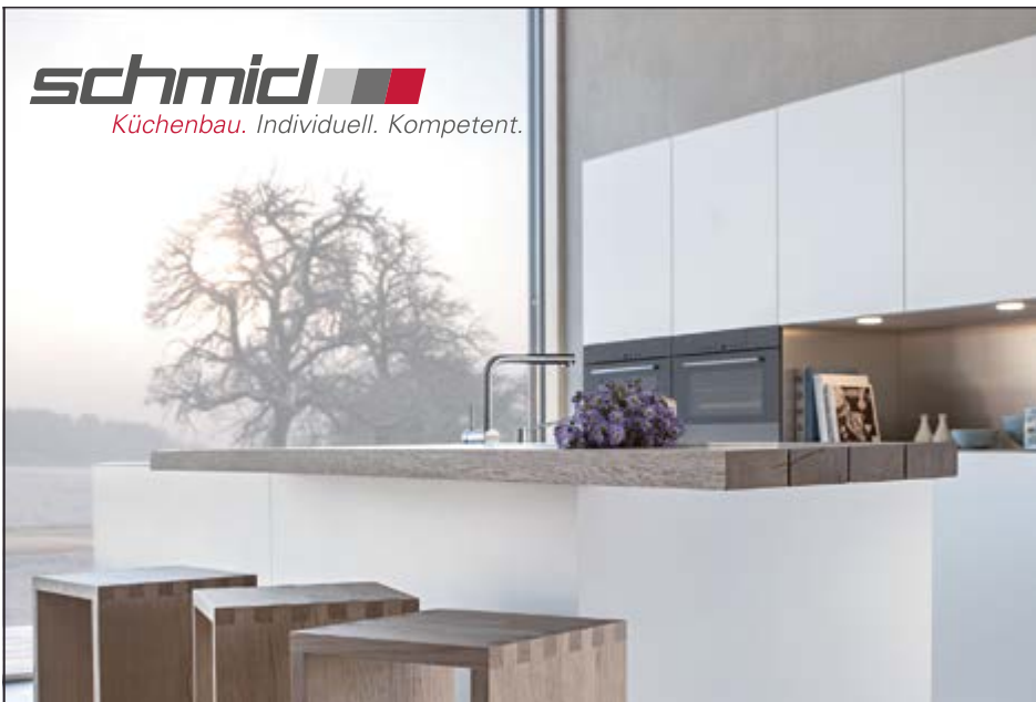
Schmid AG Küchenbau | Industriestrasse 10 | 3661 Uetendorf | www.schmidkuechen.ch

Grosse Auswahl an Vorhang- und Möbelstoffen